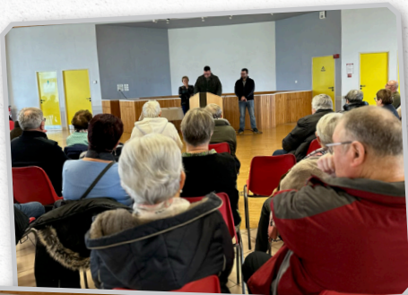
Vœux du Maire délégué à la population et aux forces vives de la commune déléguée - 6 janvier