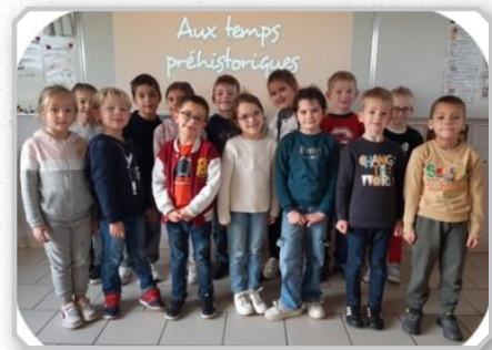
Chant des CP pour le Téléthon