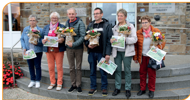
Le podium de chaque concours