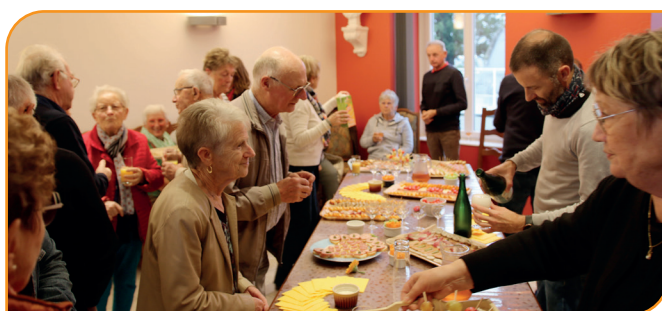
Moment de convivialité