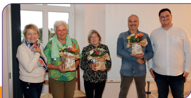
Le jury du concours